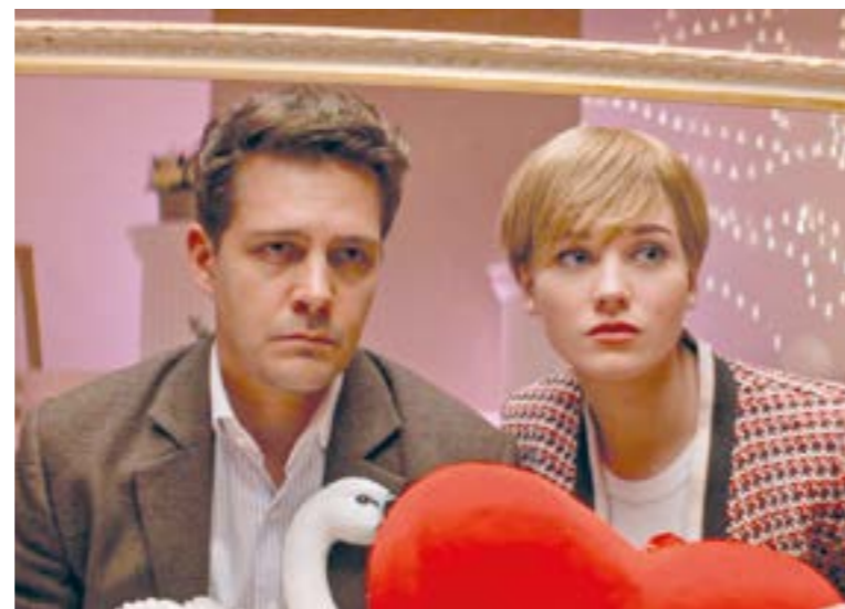
«Хочу замуж» (12+)