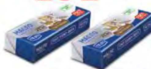
Масло сливочное 72.5% БЗМЖ "Деревня счастливого", 0.5 кг