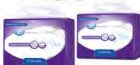
Пеленки впит. одноразовые "ID Protect" 60x90 см, 30 шт