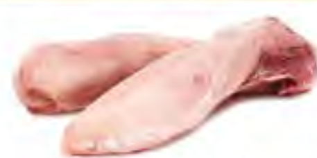
Язык свиной з/м, 1 кг