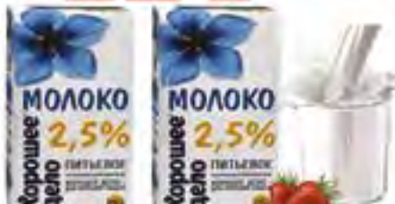
Молоко ультрапаст. БЗМЖ "Хорошее дело" 2.5%, 0.95 л