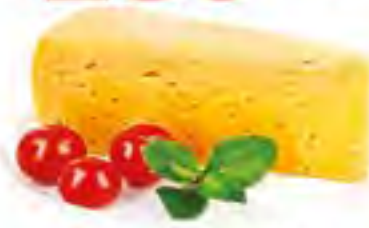
Сыр 55% БЗМЖ "Сметанковый", 100 гр