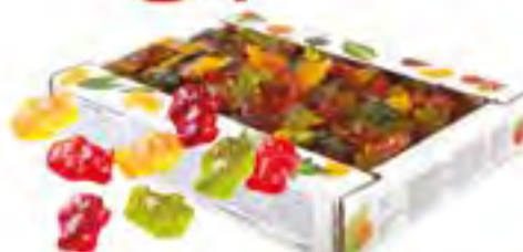
Мармелад жевательный Азовская КФ, 1 кг