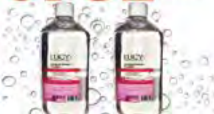
Мицеллярная вода "Lucy Cosmetics", 700 мл