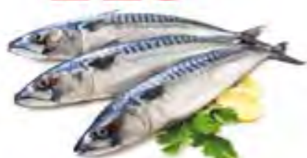
Скумбрия св/м, 1 кг