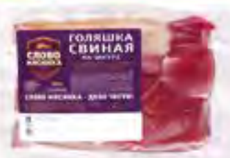
Голяшка свиная "Слово мясника", 1 кг