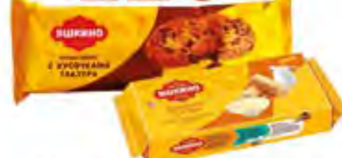
Печенье/вафельные рулеты "Яшкино", 200/320 гр