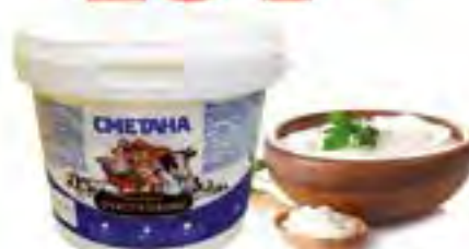
Сметана 20% БЗМЖ "Деревня Счастливого", 1 кг