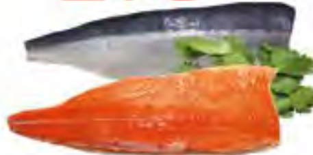
Филе горбуши на коже св/м, 1 кг