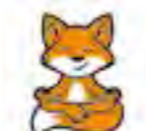
Схема проста и понятна – 13 сентября с 8:00 до 20:00 нужно будет идти до своего избирательного участка и там волеизъявиться. Казалось бы, ну что тут может пойти не так?

А вот может. На днях в редакции раздался звонок – взволнованная барышня сообщила, что очень хочет проголосовать за депутата по своему округу, но, увы, 10 сентября садится в самолет и отбывает в тёплые края. Как же быть?