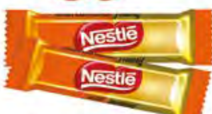
Конфеты карамель/арахис "Nestle", 0.5 кг