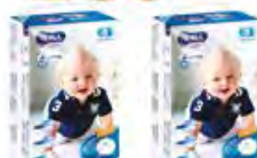
Подгузники д/детей 5/XL "Aurora Baby", 48 шт