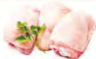
Бедро куриное охл., 1 кг