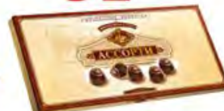
Набор конфет к/к "Ассорти", 300 гр