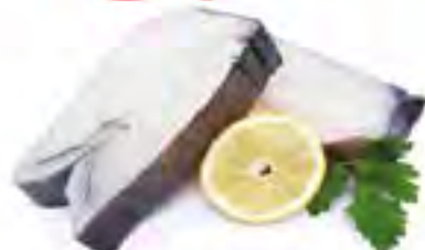
Стейк зубатки синей, 1 кг