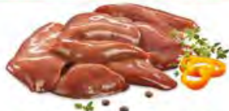
Печень куриная на подложке, 1 кг