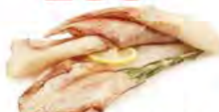
Тушка кальмара св/м, 1 кг