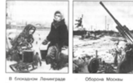
В блокаде Ленинграда. Оборона Москвы

Немецкие военачальники, нападая на СССР, рассчитывали на лёгкую и быструю победу. Сначала наши войска терпели неудачи. Но завязавшаяся битва сражалась в оборону. Советские войска стойко обороняли Смоленск, Киев, Одессу, Севастополь, другие города.