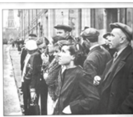
22 июня 1941 года. Москвитин слушают по радио объявление о начале войны

«ВСЁ ДЛЯ ФРОНТА! ВСЁ ДЛЯ ПОБЕДЫ!» — этот призыв звучал в те годы. Судьба страны решалась не только на полях сражений. Люди трудились без устали, чтобы фронт получил новейшее оружие: автоматы, самолёты, танки.