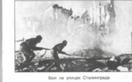
Бои на улицах Сталинграда

Летом 1942 года начались ожесточённые бои за Сталинград. Вражеские самолёты непрерывно бомбили город. Вскоре он превратился в руины. Около двух месяцев продолжались бои на улицах города. Тем временем советское командование разработало план наступления в районе Сталинграда. Оно началось в ноябре 1942 года. Немецкие войска были окружены и сдались в плен в начале февраля 1943 года. Известие об этой победе советский войска было с возмущением встречено во всем мире.