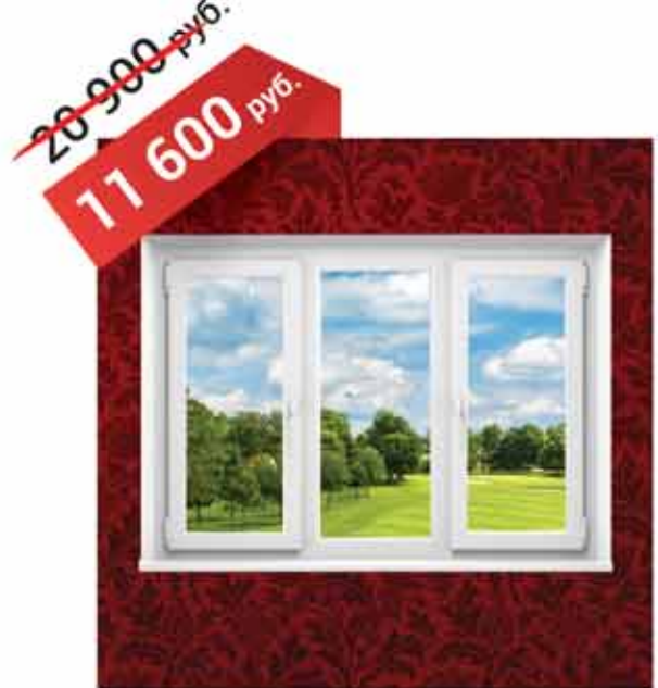
ТРЕХСТВОРЧАТОЕ ОКНО 2100x1400