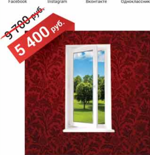
ОДНОСТВОРЧАТОЕ ОКНО 800x1200