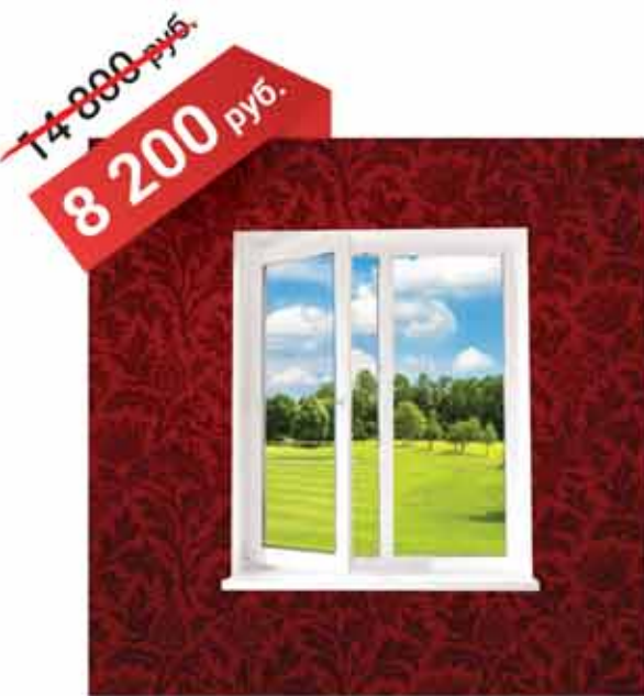
ДУХСТВОРЧАТОЕ ОКНО 1300x1400