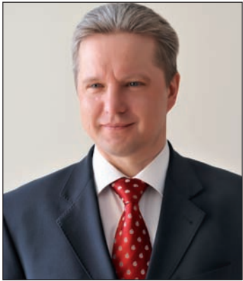
В. Д. Димитров, глава Администрации