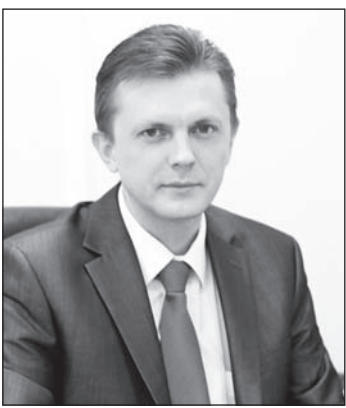
И. В. Волков, начальник ПФ РФ