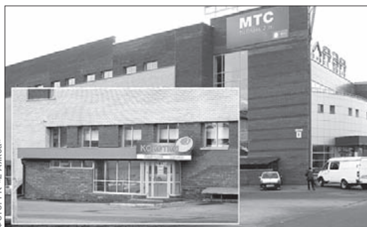
Фото: ГК «2 Аякса» ул. Московская, д.5, ТЦ «Плаза»

тает на самосовершенствование сети, расширяя ассортимент, снижая цены и принимая прочие организационные решения для удобства своих клиентов. Именно поэтому «Кокетка» из маленького и неудобного помещения на площади Ленина переехала в новый просторный магазин на цокольном этаже ТЦ «Плаза». Теперь нужна обувь – идем на Московскую, нужна одежда – также идем на ту же улицу. Потому что там два магазина «Кокетка». Первый находится в самом начале, напротив универсама «Копейка», так сказать, «обувная «Кокетка». Ранее там продавалась и одежда, затем менеджментом фирмы было принято решение сделать магазин полностью обувным. Результат – вдвое увеличилась площадь торговых залов и складов, отведенных под обувь, соответственно вдвое увеличился ассортимент, а значит, и возможности для выбора покупателя. Много ли Вы знаете в Сарове обувных магазинов, в которых одновременно представлено около 3 000 моделей? При этом ценовой диапазон на обувь, представленную в