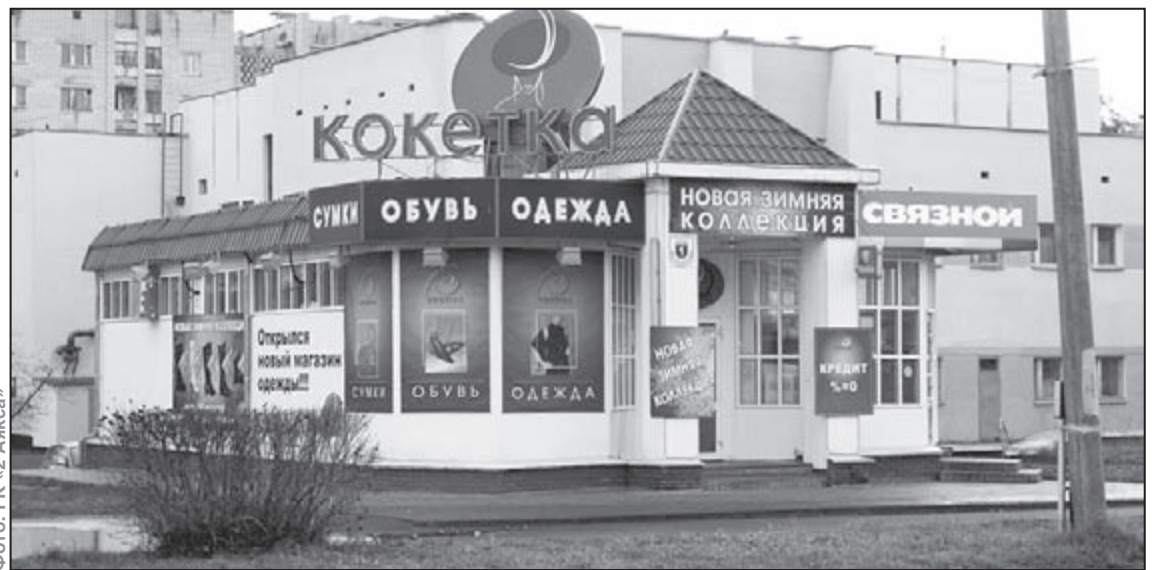
Фото: ГК «2 Аякса» ул. Московская, д.1, стр.2

Итак, что делать? Идти в магазин «Кокетка» за одеждой и обувью. Предвосхищая Ваши возможные возражения, сразу проясню некоторые моменты. У нас в Сарове сложился следующий стереотип: «В городе ничего не купишь. Я лучше поеду в Нижний Новгород, Арзамас и т. п. и там куплю все, что мне нужно». Но только представьте, как Вы в свои законные выходные вместо отдыха всей семьей грузитесь в машину, тратите время, здоровье и нервы в долгой, не всегда приятной дороге. Затем в течение многих часов кружите по многочисленным магазинам с немаленькими ценами. Гарантии, что Вы сможете подобрать себе вещь по вкусу и возможностям за одну поездку, никакой. А еще возвращаться обратно! Кроме того, одежда и обувь в крупных торговых центрах Нижнего Новгорода из-за астрономической арендной платы на 30-50% до-